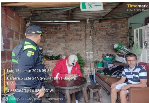
Evidencia Fotográfica 7. Sensibilización ley 1801 de 2016.