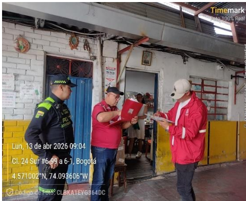
Evidencia Fotográfica 2. Sensibilización ley 1801 de 2016.