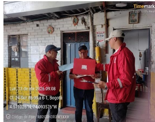
Evidencia Fotográfica 3. Verificación de documentos.