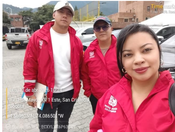
Evidencia Fotográfica 11. Fin de la actividad IVC de Establecimientos de Comercio