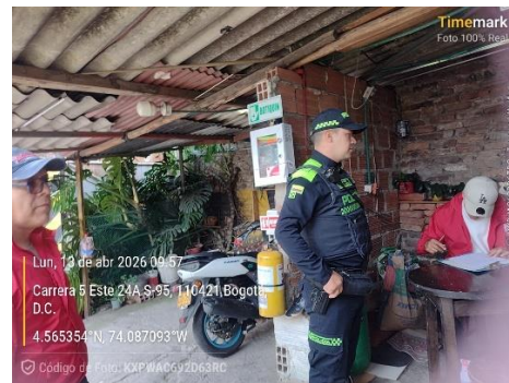
Evidencia Fotográfica 8. Revisión de documentos.