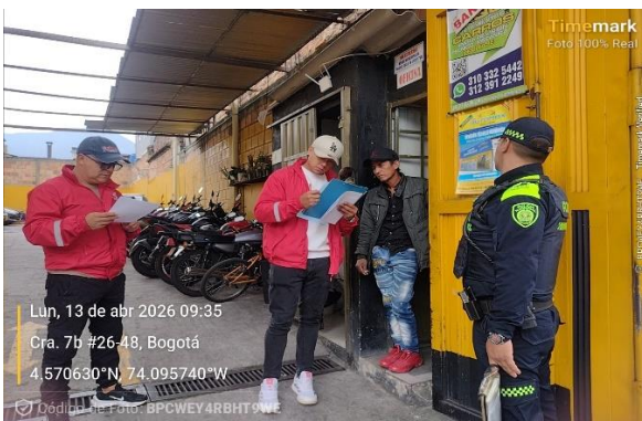
Evidencia Fotográfica 5. Sensibilización ley 1801 de 2016.