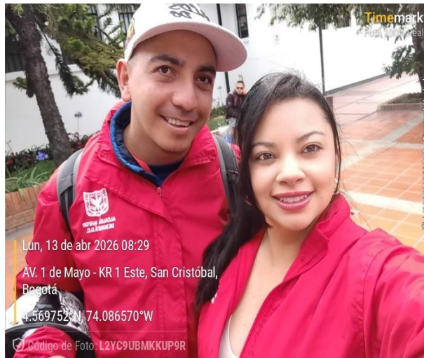
Evidencia Fotográfica 1. Inicio de actividad IVC Establecimientos de Comercio.

La actividad de IVC tiene como finalidad verificar el cumplimiento de las disposiciones normativas en materia de convivencia, así como de las condiciones sanitarias y ambientales exigidas a los establecimientos de comercio, conforme a la normativa vigente, contribuyendo a la mitigación de riesgos y la prevención de comportamientos contrarios a la convivencia