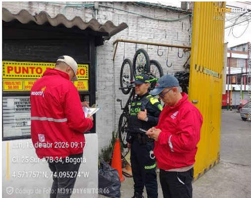
Evidencia Fotográfica 4. Sensibilización ley 1801 de 2016.