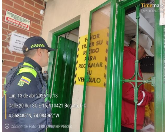
Evidencia Fotográfica 9. Sensibilización ley 1801.